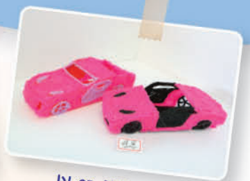
以 3D 筆製作汽車 5A 謝愷恩