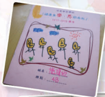
「健康為樂，恩你而起」