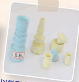
以微型車床製作粉筆雕塑 5A 陳冠敏