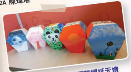
中秋圓夢摺紙天燈 (左至右) 4A 高凱兒、4A 林穎欣 4B 賴韻怡、4B 楊凱琳 4A 尹翠君、4B 施瑋欣 4A 關倩怡、4A 忻祖宜 4A 劉芷均、4B 吳泳渝