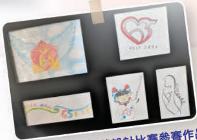
明愛 65 週年徽號設計比賽參賽作品 (從上至下, 左至右) 4B 楊凱琳 4A 廖冰冰 4B 吳泳渝 3A 余金汶 4B 賴韻怡