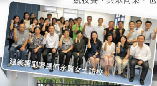
建築署副署長何永賢女士訪校