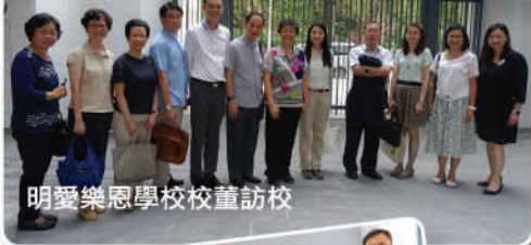
明愛樂恩學校校董訪校