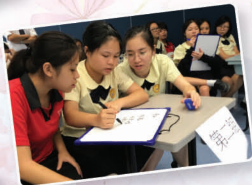
時事常識問答比賽