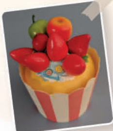
CUPCAKE 手工藝創作 4A 高凱兒