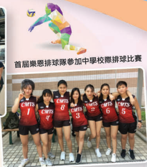
首屆樂恩排球隊參加中學校際排球比賽