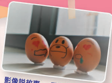
影像說故事—雞蛋人 4B 楊凱琳、賴韻怡、吳泳渝