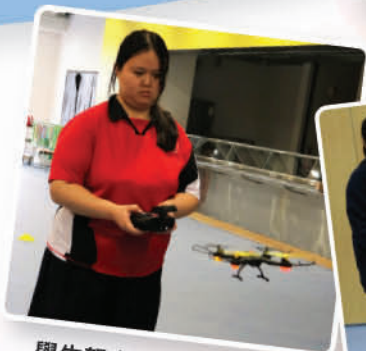
學生努力學習操作航拍儀