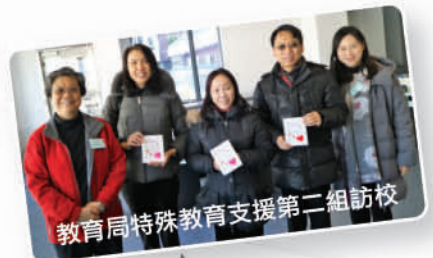
教育局特殊教育支援第二組訪校

開校至今，樂恩得蒙各方友好來訪，表達對學生和教職員的關懷和愛護，令我們倍感欣喜。各來賓除了參觀校舍外，還關注學校短期和長遠的發展，給我們很多寶貴意見，謹在此予以萬二分感謝。去年十二月中，明愛樂恩校董會、建築署、福利建築有限公司、樂恩中心及樂恩學校全體員生，在落成不久的籃球場進行了一場友誼競技賽，與眾同樂，也為新落成的籃球場揭開序幕。