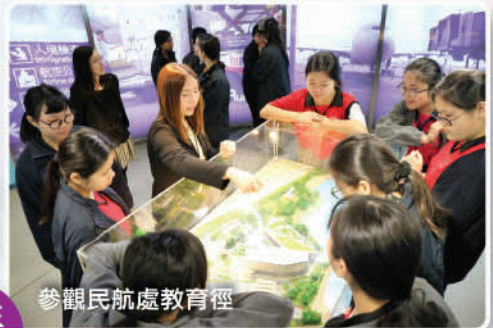
參觀民航處教育徑

這個活動相當有趣，既能強身健體，支持環保，又能藉著欣賞珊瑚教育下一代關於垃圾對自然環境的傷害。