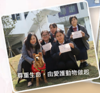
尊重生命，由愛護動物做起