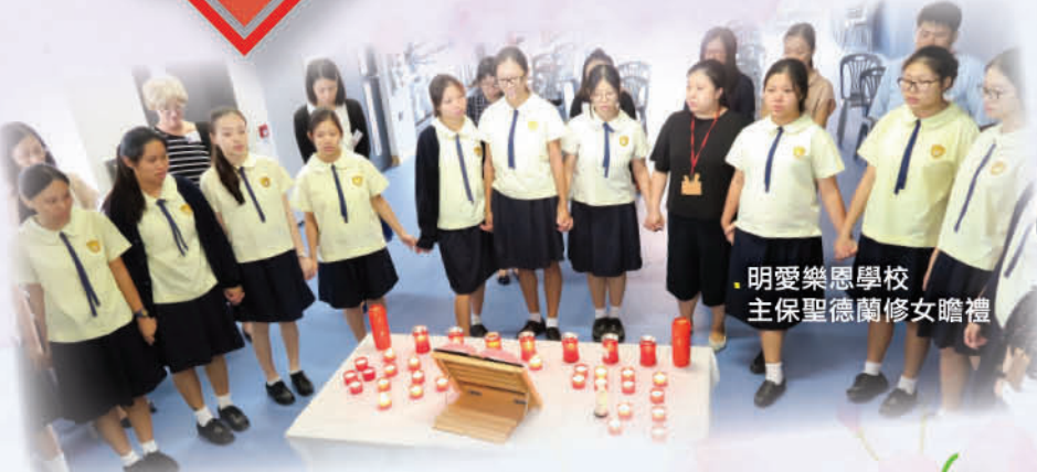
明愛樂恩學校 主保聖德蘭修女瞻禮