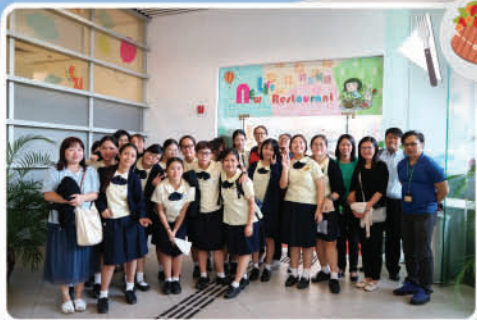
參觀新生餐廳 Café 330