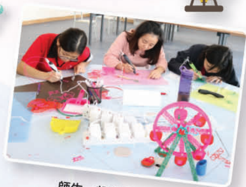
師生一起運用3D筆製作模型