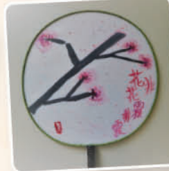
從文字表現感恩—水墨扇 4B 吳泳渝