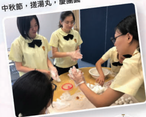
中秋節，搓湯丸，慶團圓