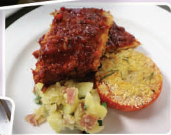
中五學生參加應用學習課程，學習西式食品製作