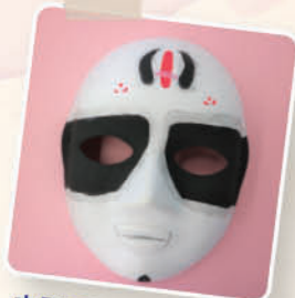
中國面譜設計 1A 戴慧盈