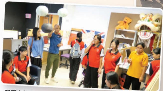
明愛白英奇專業學校設計系導師向同學介紹日常學習情況