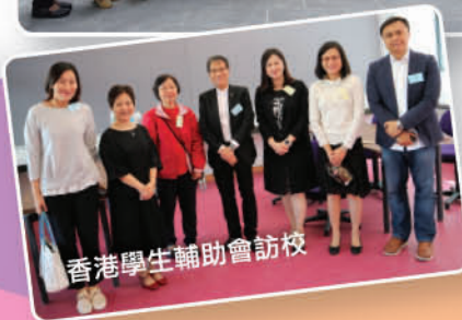
香港學生輔助會訪校