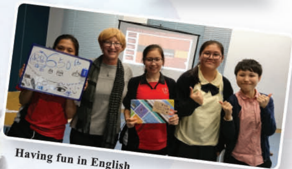
Having fun in English