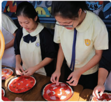
學生參觀Pizza Express 兼製作薄餅