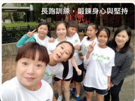
長跑訓練，鍛鍊身心與堅持